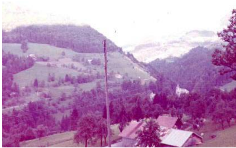
El pueblo que aparece abajo es Thones y esta parte alta se llama Chamoisier.