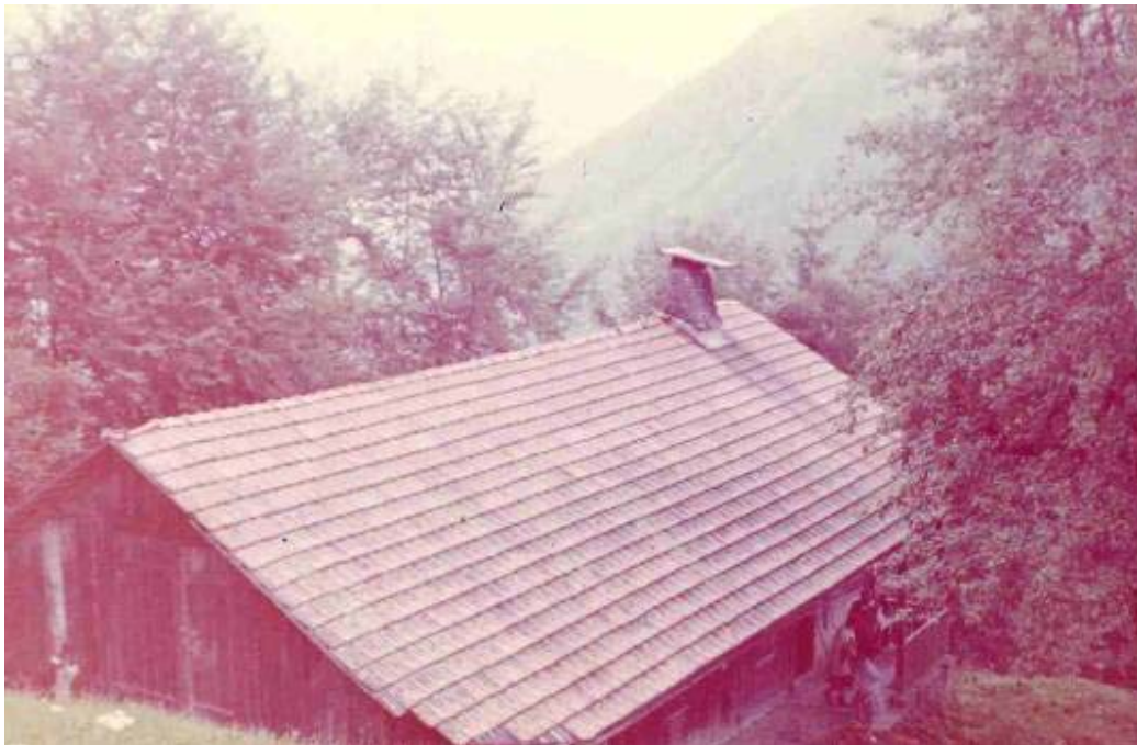
Fotos de la Cabaña