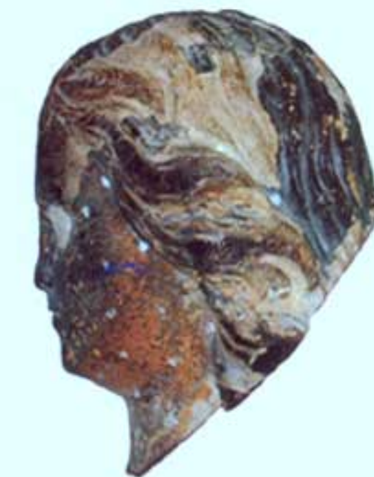
Primitiva cabeza de Nuestra Señora del Carmen, tallada por Dupar en el siglo XVIII y recuperada tras el incendio de la iglesia en 1936.